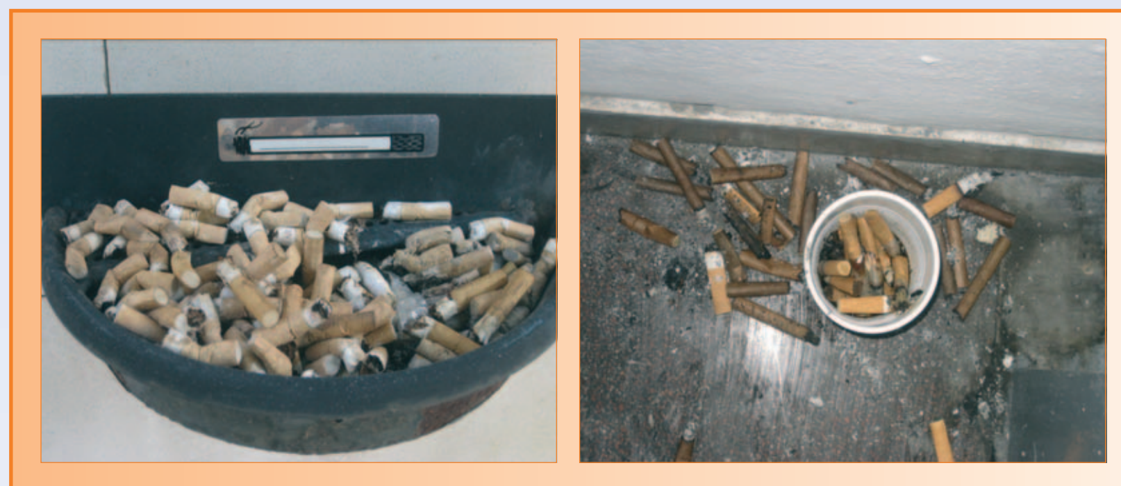
Fotografías tomadas en el Hospital del Mar auditoría 2011

Encuesta validada de prevalencia del consumo de tabaco, realizada en 2001, 2004, 2009 y 2011, a 310, 276, 486, 384 trabajadores activos, respectivamente. Muestreo aleatorio estratificado según sexo, edad y categoría laboral. El tamaño necesario de las muestras fue calculado para un error máximo del 5%, un nivel de confianza del 95%, y una prevalencia de fumadores del 30%