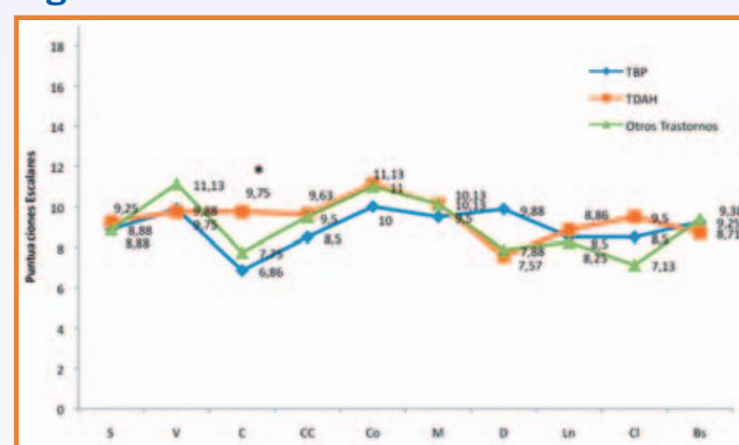
Figura 2. Pruebas WISC IV